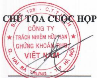
Chin Yoong Kheong Chủ tịch Hội đồng Thành viên